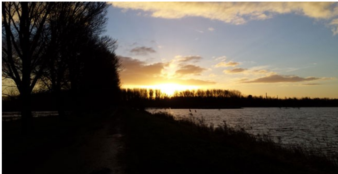
Opkomende zon tijdens een stiltewandeling in de Broekpolder